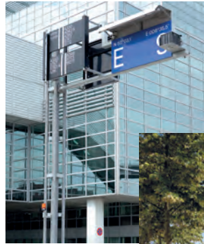
Bilder oben und Bild rechts: Für reibungslose Abläufe bei Flughafen- und Verkehrsgesellschaften kommen passgenaue MONTUM-Lösungen in den Bereichen Bodenstromversorgung, Vorfelbleuchtung, Energieversorgung, Lichtmast- und Sondermastsysteme zum Einsatz.

Stahlmastbau und Handel. Die Bündelung von Know-how und Ressourcen erlaubt die Realisierung von besonders anspruchsvollen und volumenreichen Aufträgen. Im Mittelpunkt stehen dabei die Bedürfnisse von Gewerbe- und Industriekunden in Deutschland und dem europäischen Ausland. Ob industrielle Anlagen, Kraftwerke oder öffentliche sowie gewerbliche Gebäude – hochqualifizierte Spezialisten sorgen für die erforderlichen Elektroinfrastrukturen sowohl bei Neubauten als auch bei Modernisierungen und Umrüstungen, u.a. hinsichtlich Spannungs- und Schaltanlagen, Beleuchtung, Brandmeldetechnik, Videoüberwachung, E-Ladestationen, Trafostationen, Kabelverlegung und weiterem mehr. Von Beratung, Planung, Lieferung, Montage, Inbetriebnahme bis hin zu regelmäßigen Wartungen leistet MONTUM einen umfassenden Service aus einer Hand.