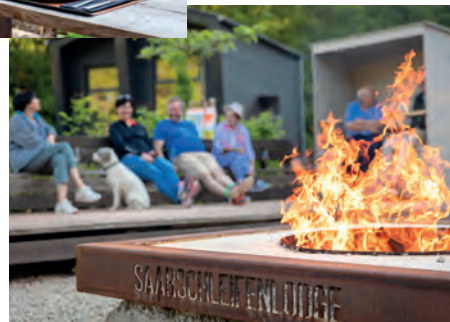
Bilder links: Neben Naturerleben und Entleunigung steht die Saarschleifenlodge auch für regionale kulinarische Spezialitäten, die die Pensionsgäste genießen können. Zur gemütlichen Einkehr verlocken auch eine Weinbar und eine knisternde Feuerstelle.