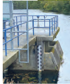
Bilder oben und links: Innovative Sensortechnik von dimeto erhebt u.a. Umweltdaten, wie Regen und Hagel, oder hilft bei der Messung von Pegelständen bei Gewässern.

dern realisiert. Für die dimeto-Technologien bieten sich verschiedenste weitere Anwendungsmöglichkeiten an, darunter z.B. das Erfassen von Besucherzahlen oder die Belegung von Parkplätzen. Üblicherweise knüpft das Unternehmen Geschäftskontakte auf nationalen und internationalen Messen. Als diese, ebenso wie Ausschreibungen, während der Corona-Pandemie jedoch ausfielen bzw. stark vermindert waren, nutzte dimeto zwischenzeitliche Sofortkreditmittel der SIKB, um das Unternehmenswachstum nach anschließender Markterholung erfolgreich fortzusetzen.