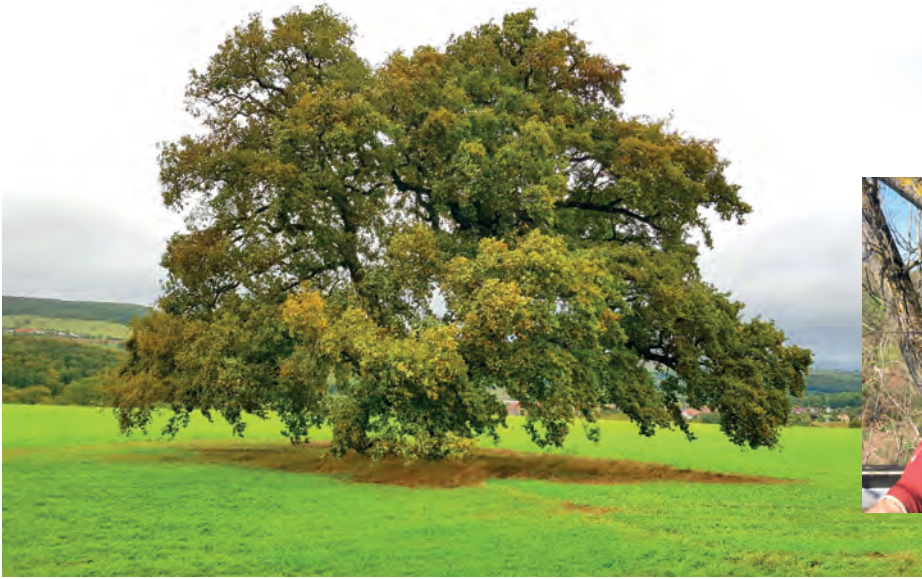
Bild links und Bild unten: Ob Umweltbelastungen, Krankheiten oder Schädlinge – Bäume sind vielen Stresssituationen ausgesetzt und bedürfen fachgerechter Betreuung. Mittels modernster Methoden ermittelt Die Baumpfleger GmbH den Gesundheitsstatus und ergreift Versorgungsmaßnahmen.