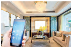
Bild rechts und Bild oben: Neben Industrie und Gewerbe werden auch Privatkunden in den Bereichen Haustechnik, Smart Home und allem, was zum Elektrohandwerk gehört, bedient.

Von der Symbiose aus Stahlmastproduktion und Elektrotechnik-Know-how profitieren auch Betreiber von Sport- und Freizeitanlagen, seien es lokale Vereine oder nationale Proficlubs,