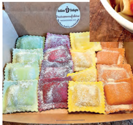
Bild oben und links: Pasta in allerlei Variationen gibt es zur finalen Zubereitung zuhause. Zusätzlich wird täglich auch eine warme Speise zum Mitnehmen vor Ort angeboten.