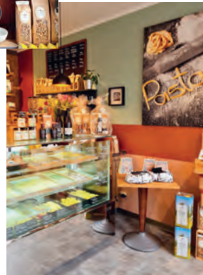
Bild links und Bilder oben: In der italianDelight Pastamanufaktur von Tina Bonaffini Caputo in Saarbrücken gibt es selbstgemachte Pasta – hergestellt nach traditionellen Rezepten und unter Verwendung natürlicher, regionaler Zutaten von saarländischen und italienischen Erzeugern.